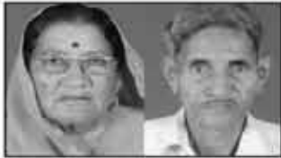
માતુશ્રી મોઘીબેન ગેલા નરપાર છેડા ગાગોદર