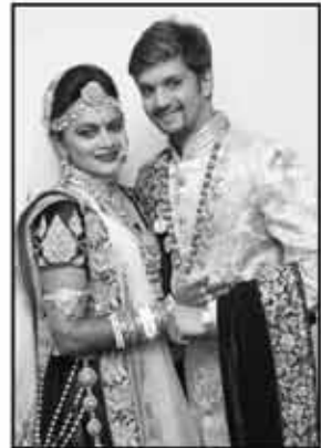
ચિ.નીધી અને ચિ. ધનીક

સંસ્થામાં આશ્રીત અંદાજે ૨૦૦૦ મુંગા પ્રાણીઓ આશિષ પાઠવે છે.