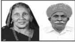
માતુશ્રી ધનીબેન દેમરાજ હોચી ગડા મનફરા