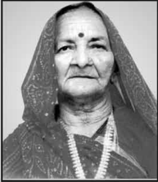
માતુશ્રી મોંઘીબેન રાઘવજી ગાલા ગામ : થોરીચારી