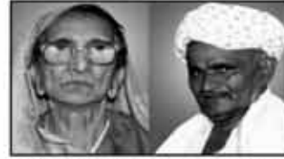
માતુશ્રી મીઠીબેન અરજણ ભયુ ગાલા લાકડીયા